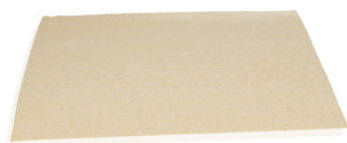
111004 BLADERDEEGPLAK 57 X 37 CM 15st. (DIEPVRIES)