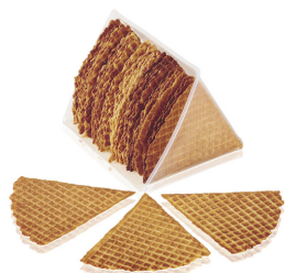
315003 EVENTAILS ARTISANAUX 6 X +/- 36 PIECES