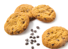
554004 KOEKJES CHOCOLADE 800G

*Niet cumuleerbaar met nationale promokortingen, netto-tarieven en contractprijzen.