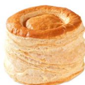
121019 BOUCHEES PATISSIERES 7 CM 90 PIECES