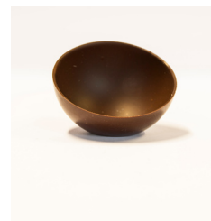
213021 CHOC. ZETELTJE PUUR 30 STUKS