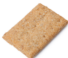
454004 TOAST CROCCANTE 1 KG ( +/- 250 stuks )