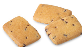
554001 KOEKJES ZAMBIA 700G