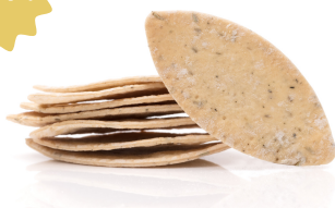
444004 APERERO LEAVES THYME 1KG