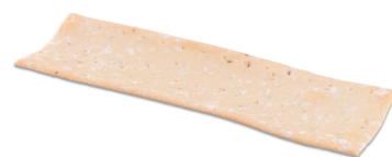
444002 FLATBREAD 800G